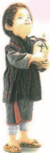
ATAE YURI An Email for Daddy © Shirayuki Planning Co., Ltd. 2001