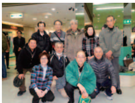
準優勝 城南出張所