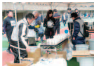
▲ランナーへの給水サポートの様子

就業時間は午前7時から午後6時まで、途中休憩が2時間ありますが、受付、給水または走路安全係として、まる一日就業されました。